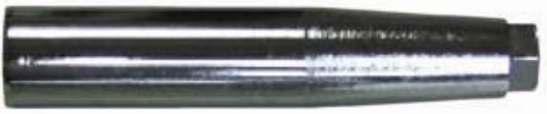
A130L ホイールセンタリングガイドL