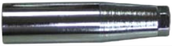
A100S ホイールセンタリングガイドS

ISOホイールはJISタイプと異なり、ホイールセンタリングのための球面座がありません。22mmのボルトが26mmのホイール穴(平面座)を通るためセンターが出ません。センタリングガイドを対角にセットしてホイールを通すことで確実なセンター出しができます。