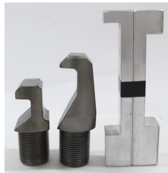
爪(ショート・ロング) リングスペーサー(戻り防止用)